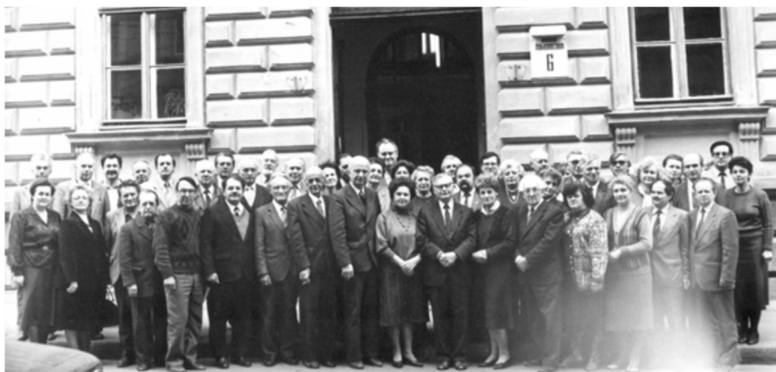
Учасники конференції «Історія хімічної науки в часи діяльності Наукового Товариства ім. Шевченка та Української Академії Наук у Львові».

Конференція пройшла на високому рівні у плідних дискусіях.