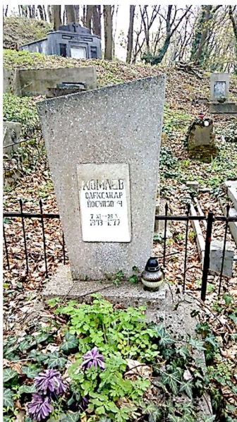
На Личаківському цвинтарі у Львові.

29 жовтня 1972 року він помер. Похований у Львові на Личаківському цвинтарі.