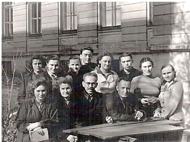
У дворику хемічного факультету університету. 1956 р..

– Ідьте туди, вивчайте нашу історію, пізнавайте місця козацької слави.